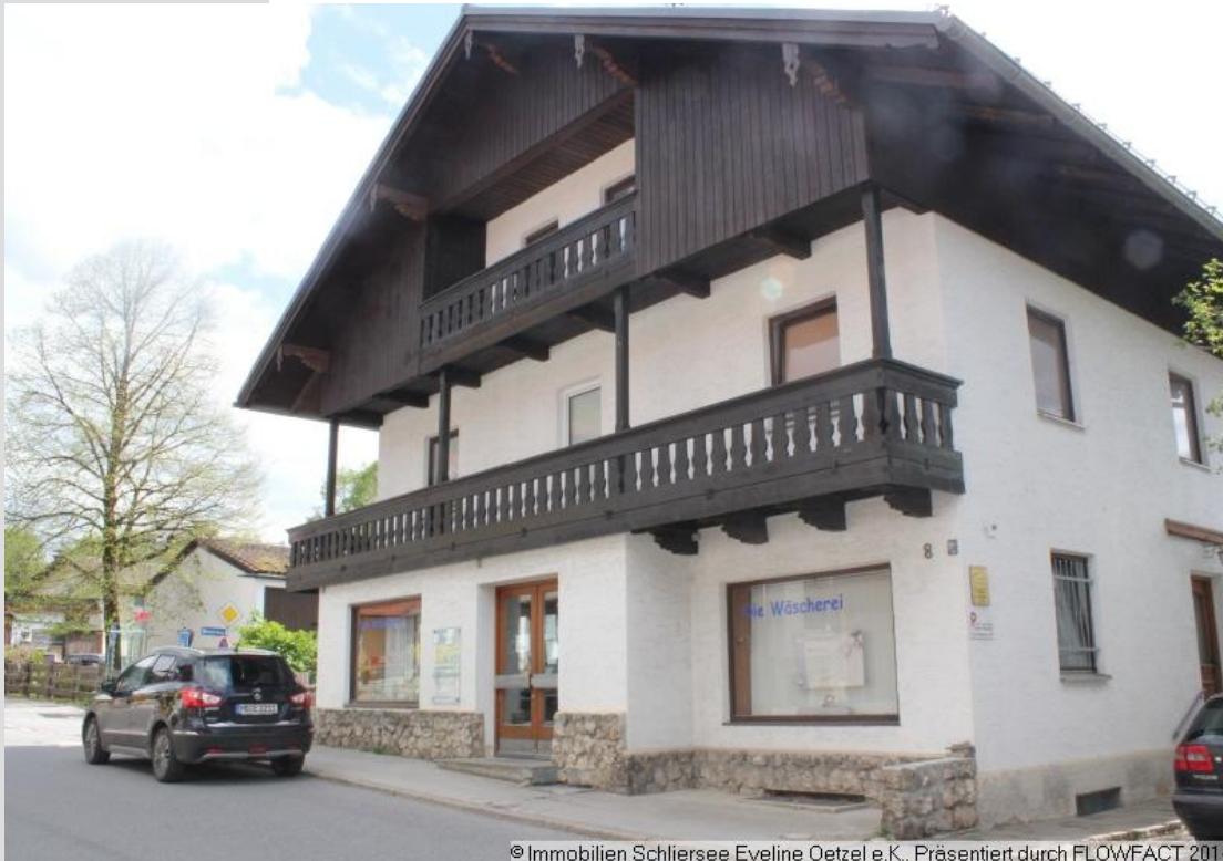
© Immobilien Schliersee Eveline Oetzel e.K., Präsentiert durch FLOWFACT 2014