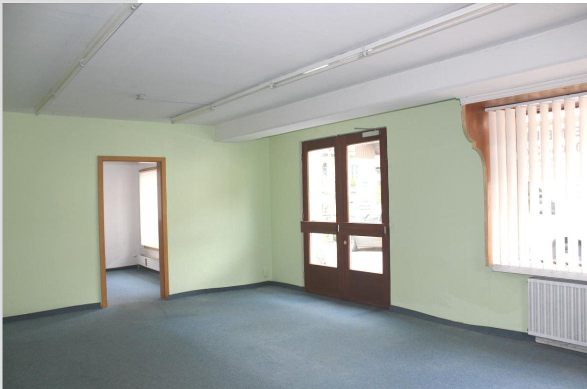
Verbindung beider Zimmer